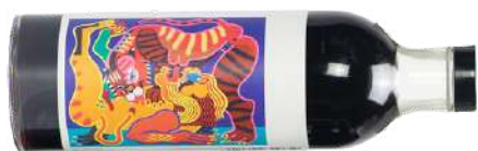
Maus Ratafia 16% VOL

Maus va nèixer a Cardedeu durant el confinament la primavera de l'any 2020, on 5 amics els sorgeix la idea de fer un nova interpretació de la ratafia.